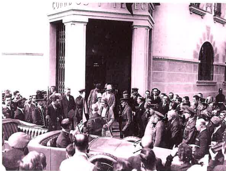
La Reina Victòria Eugènia inaugurant l'Oficina de Correus i Telègrafs de L'Hospitalet