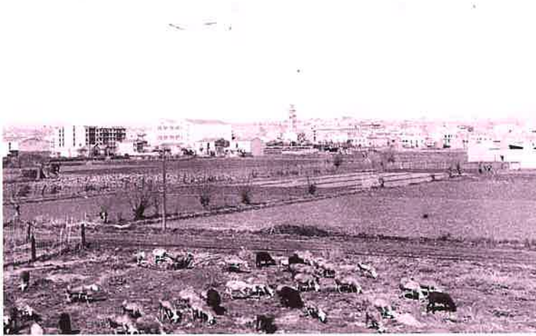
La Marina. Al fons, L'Hospitalet Centre

La ciutat va creixent després de la guerra, una mostra d'això seran les constants parròquies que van naixent allà on s'assenten o augmenten els nuclis de població 14 .