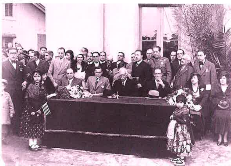
Inauguració de l'Escola Can Bori per Francesc Macià