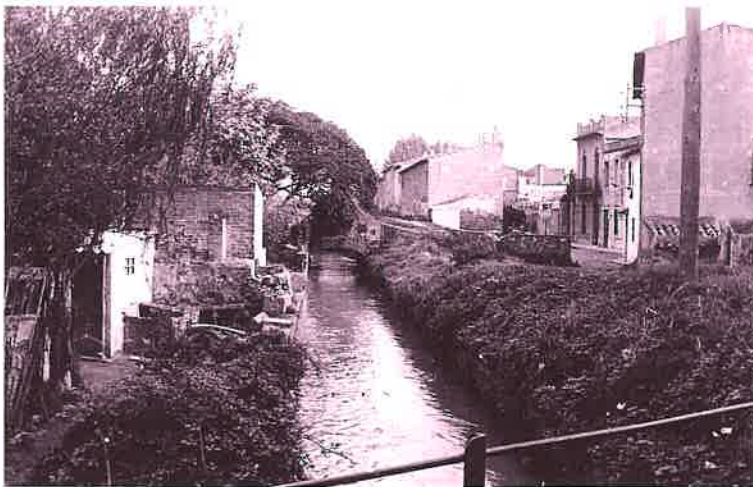
Canal de l'Infanta, 1965

Un dels canvis més significatius en la vida de la ciutat vindrà de la seva relació amb l'aigua. Antigament, les constants riuades del Llobregat inundaven el terme municipal, fins fa ben pocs anys que la canalització i la millora de les infraestructures han permès deixar enrera la por a l'aigua. Per contra, la manca d'aigua va fer necessària la construcció, el segle passat, d'un canal que aportés aigua a la zona nord del terme municipal per tal de convertir els conreus de secà en terres d'horta.