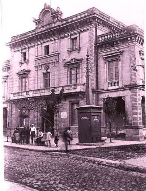
Casa Consistorial de L'Hospitalet, cap el 1920