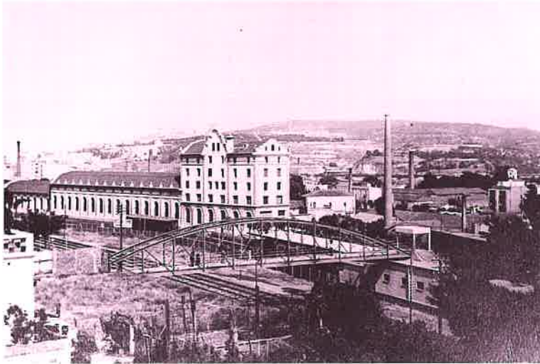
Pont de Santa Eulàlia, 1933