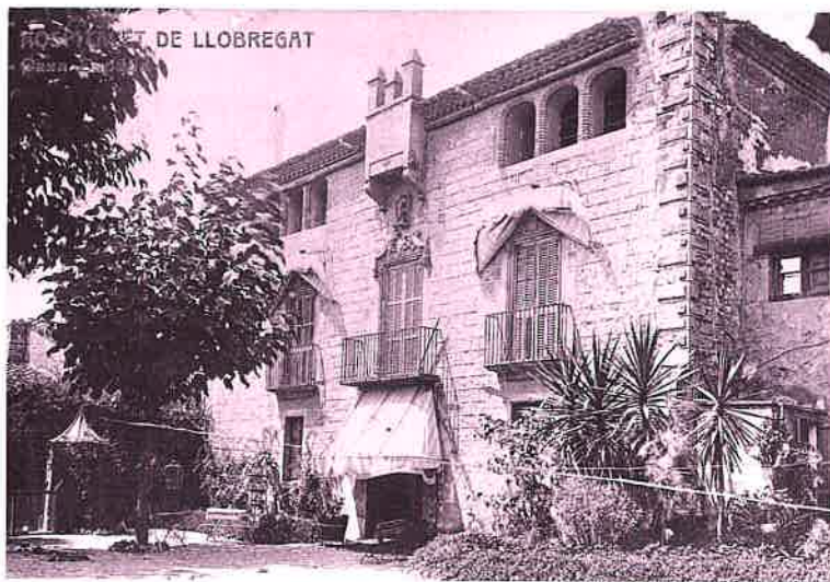
«Can Boixeres» i «Casa España»

d'Esports i el primer centre d'ensenyament mitjà. Els anys seixanta, neixen els barris més joves de la ciutat: Bellvitge i Can Serra 15 . Els veïns de la Florida i Pubilla Casas reclamen que l'Ajuntament estengui els serveis al barri per tal de millorar les seves condicions de vida. La urbanització s'havia realitzat amb presses i amb poques garanties de qualitat. En poc més de deu anys la població de la ciutat s'ha duplicat, a L'Hospitalet ja hi viuen 180.000 persones.