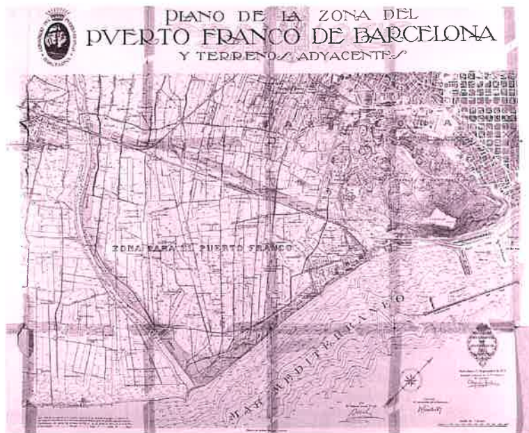
Plànol del Port Franc de Barcelona i terrenys adjacents. 1926

No serà fins al 1918 que Just Oliveras, emparentat amb Rossend Arús, reprèn la seva tasca al front de la corporació municipal fins al 1923 que serà reemplaçat, per Reial Ordre, per Josep Muntané i Almirall 9 .