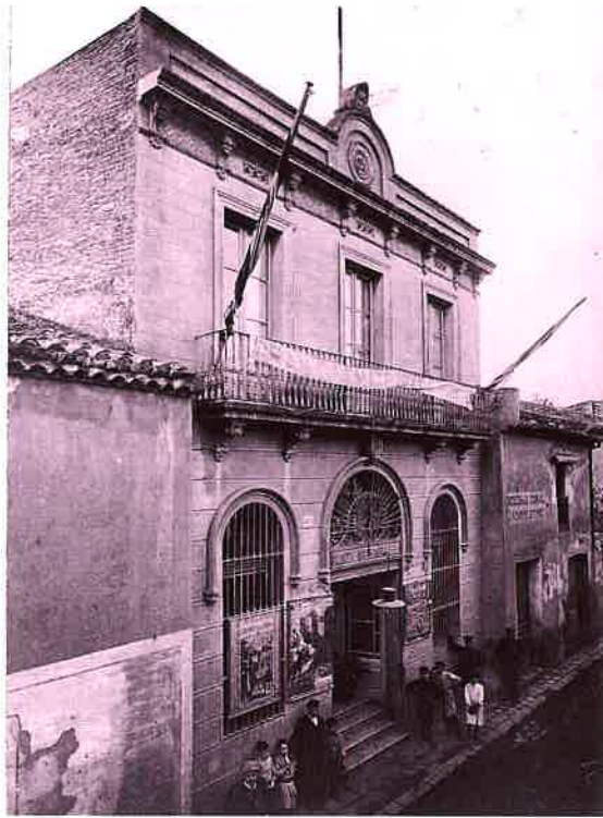
Cinema Robert «Cal Carreter». 1907